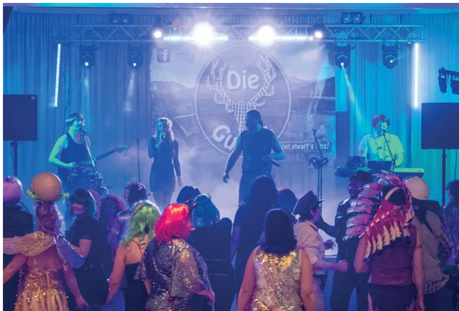
Kein verspäteter Aprilscherz: Lustige Kinderfeste, rauschende Faschingsbälle, unterhaltsame Konzerte, Vorträge, Tanznachmittage und ehrenvolle Feierstunden. Das Alles soll nach Meinung des Bürgermeisters in Zukunft im Turnsaal oder in der Reithalle stattfinden!

diverse Weihnachtsfeiern und Festveranstaltungen. Wohin sollen die Musiker ausweichen? Noch dazu,