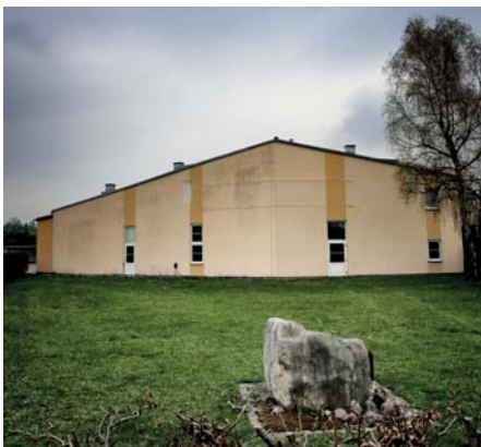
Unser Volksheim: Sanierungsbedürftig, aber keineswegs ein Totalschaden. Und für die Bewohner unentbehrlich.

der Schifferverein mit seinem traditionellen Schifferjahrtag - in welches „geruchsbeeinträchtigte Ambiente“ soll der ausgelagert werden - ins Pferdezentrum? Als Ersatzlösung ernsthaft angedacht ist wie man hört, auch eine Mehrzweckturnhalle! Gemeint ist der