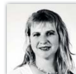
Von Renate Schöberl

In der Stadlinger Gemeindeführung werden in letzter Zeit eigenartige Entscheidungen getroffen: Zuerst schließen, schleifen, verkaufen wir. Dann schau ma mal, wie wir das auf andere Füße stellen können. Die Leidtragenden sind jene, die Hilfe bräuchten.