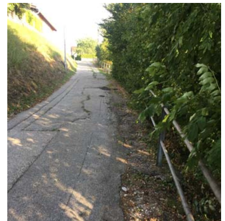
Der Windflachberg löst sich auf, doch die Sanierung wurde aufgeschoben ...