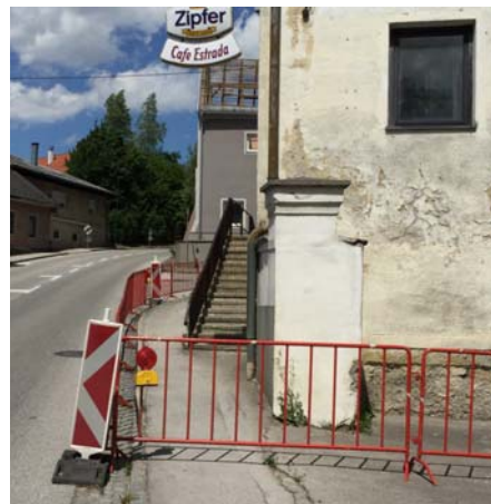
Am Bräuerg wurden für unsere Schüler hohe Hürden errichtet. Wie lange noch?

Der einzige Schulweg für die Gutenbrunnsiedlung löst sich nämlich derzeit von selbst auf. Und noch unverständlicher ist die Tatsache,