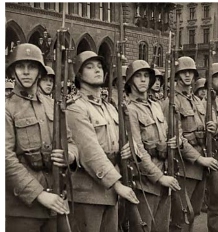
Der Heimatschutz, Heimwehr, wurde in Österreich nach dem Ersten Weltkrieg gegründet und war von 1918–1938 eine faschistische, paramilitärische Organisation um die Heimat gegen die Linken, Sozialisten, Juden und alles Fremde zu schützen und zu verteidigen.