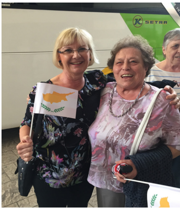
Frühjahrstreffen in Zypern