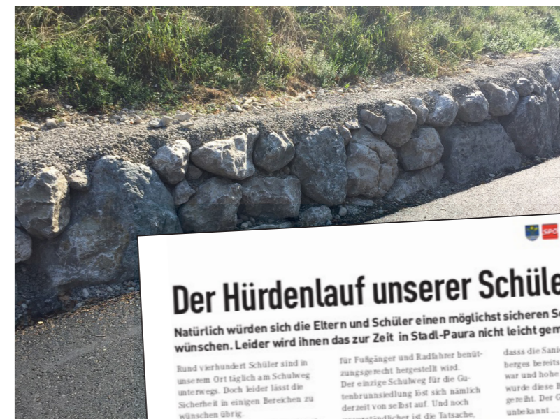
Vor einem Jahr hat die SPÖ auf den Umstand aufmerksam gemacht, nun strahlt der Weg in neuem Glanz

Dank guter Zusammenarbeit und Überzeugungskraft wurde das Projekt auch im Bauausschuss einstimmig befürwortet. Somit ist in Stadl-Paura wieder ein Teilabschnitt des Schulweges der Stadlinger Schüler ordnungsgemäß saniert und für die Öffentlichkeit wieder als gesicherter Geh- und Radweg benutzbar. Es wird uns auch der Bauhof danken, da die Winterräumung jetzt nicht mehr so aufwändig ist.