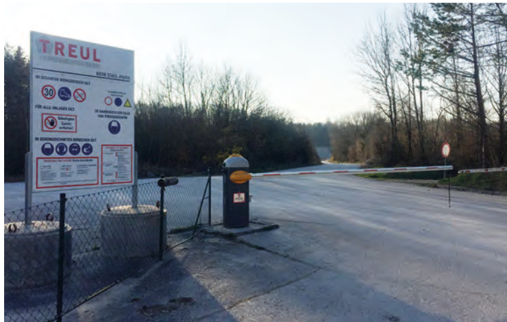
Einfahrt zum Schotterabbaugbiet Treul

In der letzten Gemeinderats-sitzung wurde der Verkauf eines gemeindeeigenen Waldgrundstücks, das direkt an die Schottergrube angrenzt, von uns verhindert. Aus strategischen Gründen sind wir gegen den Verkauf solcher Grundstücke, jedenfalls so lange, bis die Brücke über die Ager tatsächlich gebaut wird.