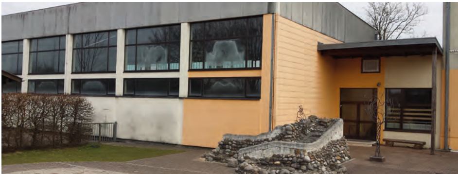
Blick vom Pausenhof auf den Volksschul-Turnsaal. Auch dieses Gebäude hat eindeutig die besseren Zeiten hinter sich.

Schon 2009 wurden von der Gemeinde die ersten Pläne für die Volksschulsanierung beim Land OÖ eingereicht. Dann wurde Stadl-Paura über Jahre hinweg immer wieder vertröstet. Die „rote“ Gemeinde wurde vom „schwarzen“ Land regelrecht abgeschasselt. Es wurden immer wieder Bestätigungen und neue Pläne gefordert.