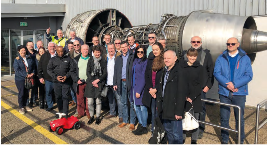
Unsere sehr internationale Gruppe am Flughafen Hannover

An der Feier im Maritim Airport-Hotel nahmen nahezu 700 geladene Gäste teil. Ein kabarettreifer Confroncier führte durch das unterhaltsame Abendprogramm, bei dem auch ehrenamtlich tätige Bürger aus Langenhagen geehrt wurden. Die dreistündige Feier verging wie im Fluge. Anschließend wurde zu einem Buffet geladen. Am nächsten Tag, nach einem gemeinsamen Frühstück der Vertreter der Partnergemeinden, ging es zu einer sehr interessanten Flughafenführung, wobei uns auch ein Blick hinter die Kulissen gewährt wurde. Der niedersächsische Jagdclub lud die Delegation anschließend zum Mittagessen ein. Danach konnten wir uns beim Bogenschießen,