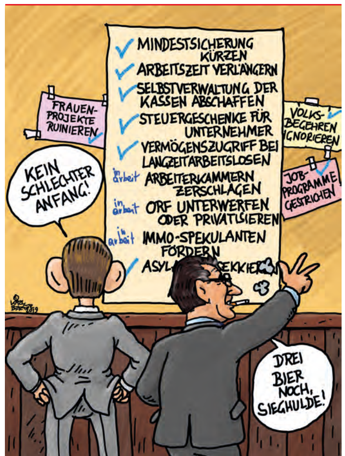
KARL BERGER | CARTOON

Die SPÖ hat schon immer vehement vertreten, dass jedes Kind gleich viel wert ist. Das war und ist ein Grundprinzip der Sozialdemokratie. Es kann einfach nicht sein, dass besser situierte Familien für ihre Kinder mehr Geld bekommen als schlechter gestellte oder gar AlleinerziehenderInnen. Aber genau das ist der Fall dank diesem Familienbonus. Da es in der türkis/blauen Regierung inzwischen normal ist, dass im Gesetzgebungsprozess nicht auf die Sozialpartner (Krankenkassen, Kammern) gehört wird, ist es nicht weiter verwunderlich, dass berechnete Einwendungen einfach ignoriert werden.