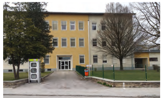
Genau hier soll die „Kiss & Go“-Zone entstehen. Es gibt bereits einen Zebrastreifen und die Bushaltestelle. Zu- und abfahrende Autos der Kiss & Go-Zone machen die Verkehrssituation für Fußgänger sicher nicht übersichtlicher.

Das derzeitige Bauprojekt verschlingt eine Unmenge an unserem Steuergeld, ohne dem eigentlichen Zweck eine Spur näher zu kommen. Mit Elternhaltestellen und einer „SchülerInnen-Geh-Zone“ könnten der Aufwand und die Kosten gering gehalten, sowie die Mündigkeit der SchülerInnen ein Stück weit gefördert werden.