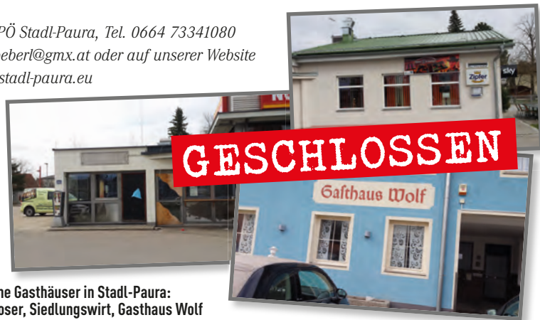
Geschlossene Gasthäuser in Stadl-Paura: Gasthaus Moser, Siedlungswirt, Gasthaus Wolf

Infos an SPÖ Stadl-Paura, Tel. 0664 73341080 oder rschoeberl@gmx.at oder auf unserer Website www.spoe-stadl-paura.eu